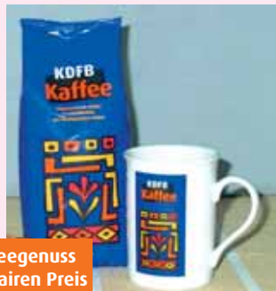
Kaffeegenuss zum fairen Preis

„ Ich trinke fair gehandelten KDFB Kaffee, weil ein verantwortlicher Lebensstil mit der täglichen Tasse Kaffee am Morgen beginnt. Damit unterstütze ich die Kaffeebäuerinnen in Honduras direkt und kann so meinen Beitrag zu einer gerechteren Welt leisten. Außerdem finde ich es toll, dass sich der Frauenbund für uns Menschen einsetzt, z. B. beim Thema Lohngerechtigkeit oder der Vereinbarkeit von Familie und Beruf! “