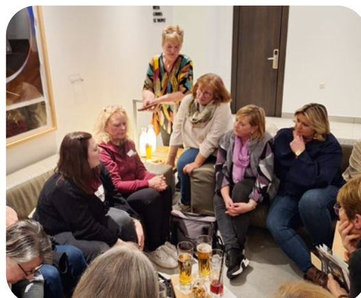
Spontaner Besuch zweier Misereor-Vertreterinnen im Hotel

Besonders beliebt war die farbenprächtige Blumenhalle, die viele Besucherinnen und Besucher begeisterte. Auch kirchliche Verbände waren auf der Messe vertreten und boten wertvolle Anknüpfungspunkte.