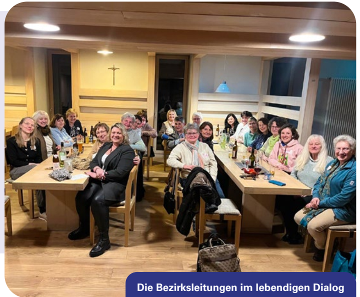
Die Bezirksleitungen im lebendigen Dialog

Im Mittelpunkt standen Achtsamkeit, Dankbarkeit, Mut, Regeneration und Selbstfürsorge. In kurzen Übungen