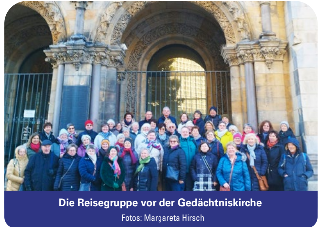
Die Reisegruppe vor der Gedächtniskirche