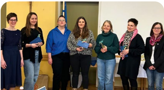
Die neuen jungen Frauen verstärken den Zweigverein Sinzing.