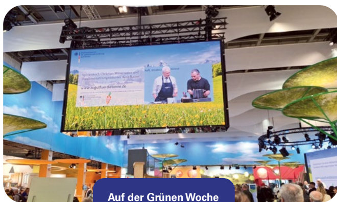
Auf der Grünen Woche

Der erste Programmpunkt am Sonntag führte in das neu gestaltete Berliner Stadtschloss, das heute als Humboldt Forum vielfältige Ausstellungen und Begegnungsräume bietet. In zwei Gruppen erhielten die Teilnehmenden spannende Einblicke in Geschichte, Architektur und Ausstellungskonzept. Der herrliche Blick von der Dachterrasse über die Berliner Innenstadt rundete den Besuch ab. Danach ging es ins Hotel Estrel, wo der Abend mit einem gemeinsamen Abendessen ausklang.